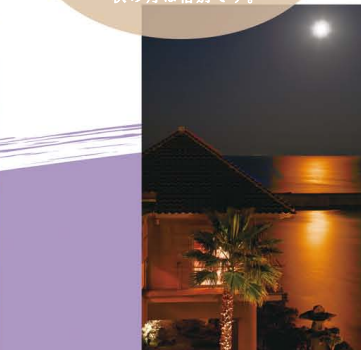
5 洲本温泉(月夜空) 幻想的な月明かりの中、お風呂やリラクゼーションをゆったり楽しんでみては。