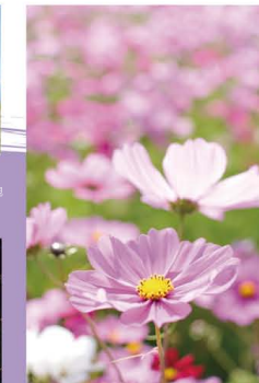
2 あわじ花さじき(コスモス) 10月は、爽やかな秋風の中、広大な高台一面に広がる色とりどりのコスモスが楽しめる。