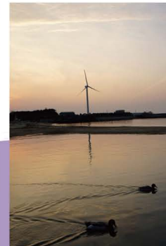
6 五色町都志(夕焼け) 夕陽が美しいと地元の人や観光客から評判の五色町。橋たがのどかに遊泳している姿も。