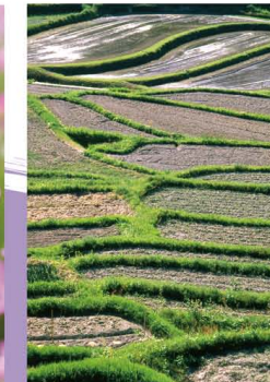
1 淡路市石田の棚田 広い谷一面に広がる高台岸の棚田風景。地形に合わせた様々な形の田舎が美しい模様をつくる。