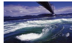
8 鳴門の渦潮 世界遺産登録への機運が高まる世界三大潮流の一つ。観潮船から間近で見ると息をのむ大迫力！