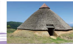
3 五斗長垣内遺跡 弥生時代後期の鉄器づくりの遺跡(国内最大規模)。高台から見える海と空の風景は爽快。