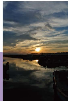
10 沼島港(夕焼け) 秋色に暮れゆく沼島港。存つがしい港町の情景やあなたが一人にも、ほっと一息できる。