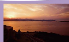
9 南あわじ温泉郷(夕焼け) 瀬戸内海に沈みゆく美しく雄大な夕陽は、心に残り、目に焼きつき、時がたつのを忘れる。