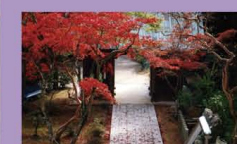
4 東山寺(紅葉) 11月頃、境内に向かい参道は真っ赤に色づく紅葉に包まれる。夜間のライトアップ観出もあり。